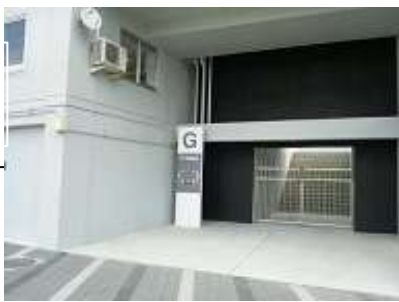
陸上競技場 メインスタンド1F